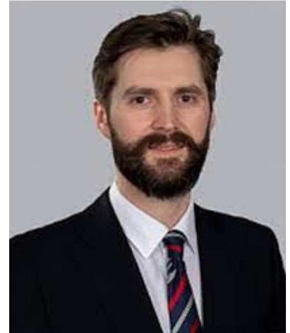
Шамьюнов Марат Маратович Заместитель Министра РФ по развитию Дальнего Востока и Арктики Заместитель начальника Московского городского казначейства