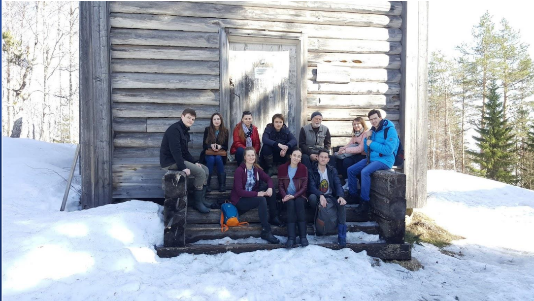
Гужово, Архангельская область